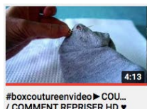
#boxcouturevideo COU... / COMMENT REPRISER HD