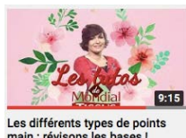
Les différents types de points main : révisons les bases !