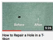
How to Repair a Hole in a T-Shirt