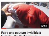
Faire une couture invisible à la main - Ou Technique du...