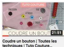
Coudre un bouton | Toutes les techniques | Tuto Couture...